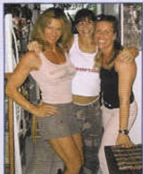
Der Bodybuilding-Lifestyle hält jung.